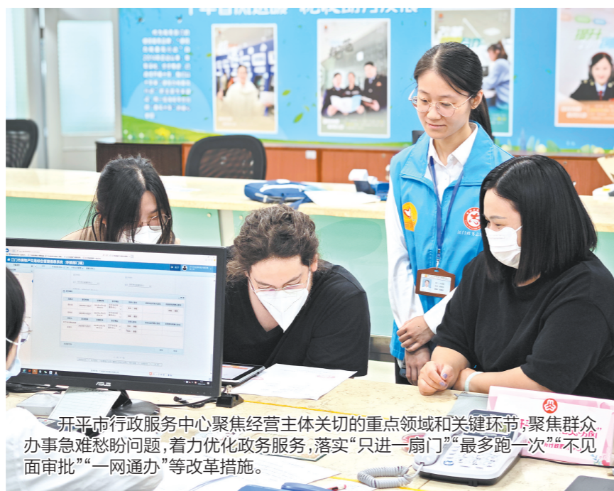
开平市行政服务中心聚焦经营主体关切的重点领域和关键环节,聚焦群众办事急难愁盼问题,着力优化政务服务,落实“只进一扇门”“最多跑一次”“不见面审批”“一网通办”等改革措施。

开平市行政服务中心通过创新实施“加减乘除”法,积极破解不动产登记业务“三大难题”,为企业群众提供更加高