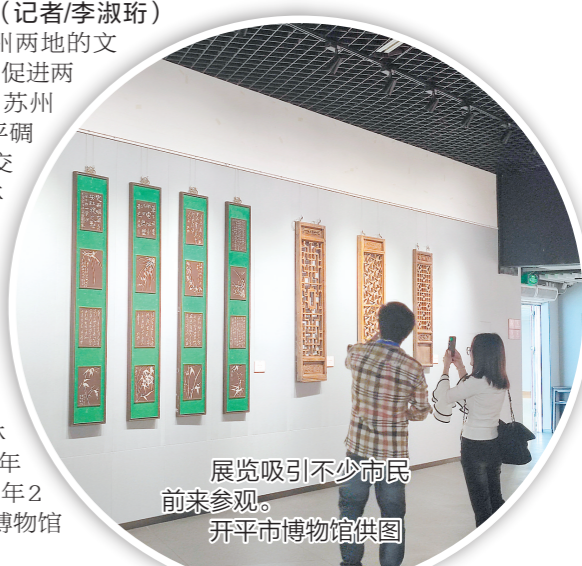
展览吸引不少市民前来参观。

展览分为“园之史”“园之观”“园之趣”三个部分,共展出精品实物70多件,包括家具、花窗、书画、贡墨、印章、刺绣、匠人工具等多个种类。走进展厅,苏绣《白猫戏螳螂》《十里荷花》、紫东珍藏昆曲手折、《求志图卷》(复制)、顾园图藏墨、墨斗等精致的藏品映入眼帘。展览彰显了苏州园林精雕细琢、古雅脱俗的造园意境与生活追求,让人感受到苏州园林博大精深的造园艺术。“后续,我们