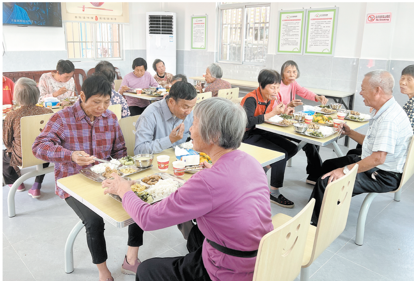
目前,开平市已建成运营11家长者食堂,覆盖7个镇和2个街道,为有用餐需求的老年人提供优质的助餐服务。