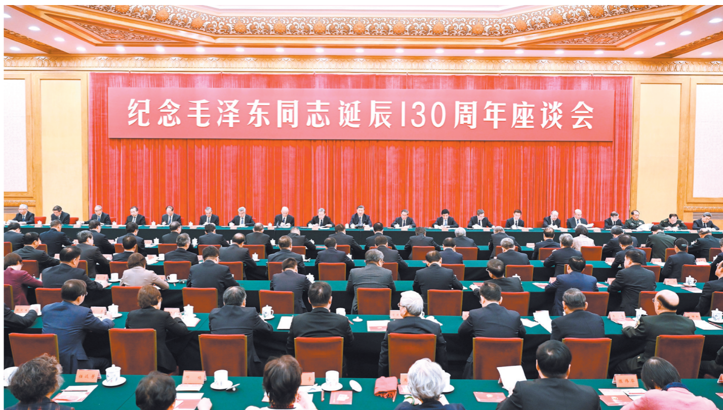
12月26日,中共中央在北京人民大会堂举行纪念毛泽东同志诞辰130周年座谈会。中共中央总书记、国家主席、中央军委主席习近平发表重要讲话。