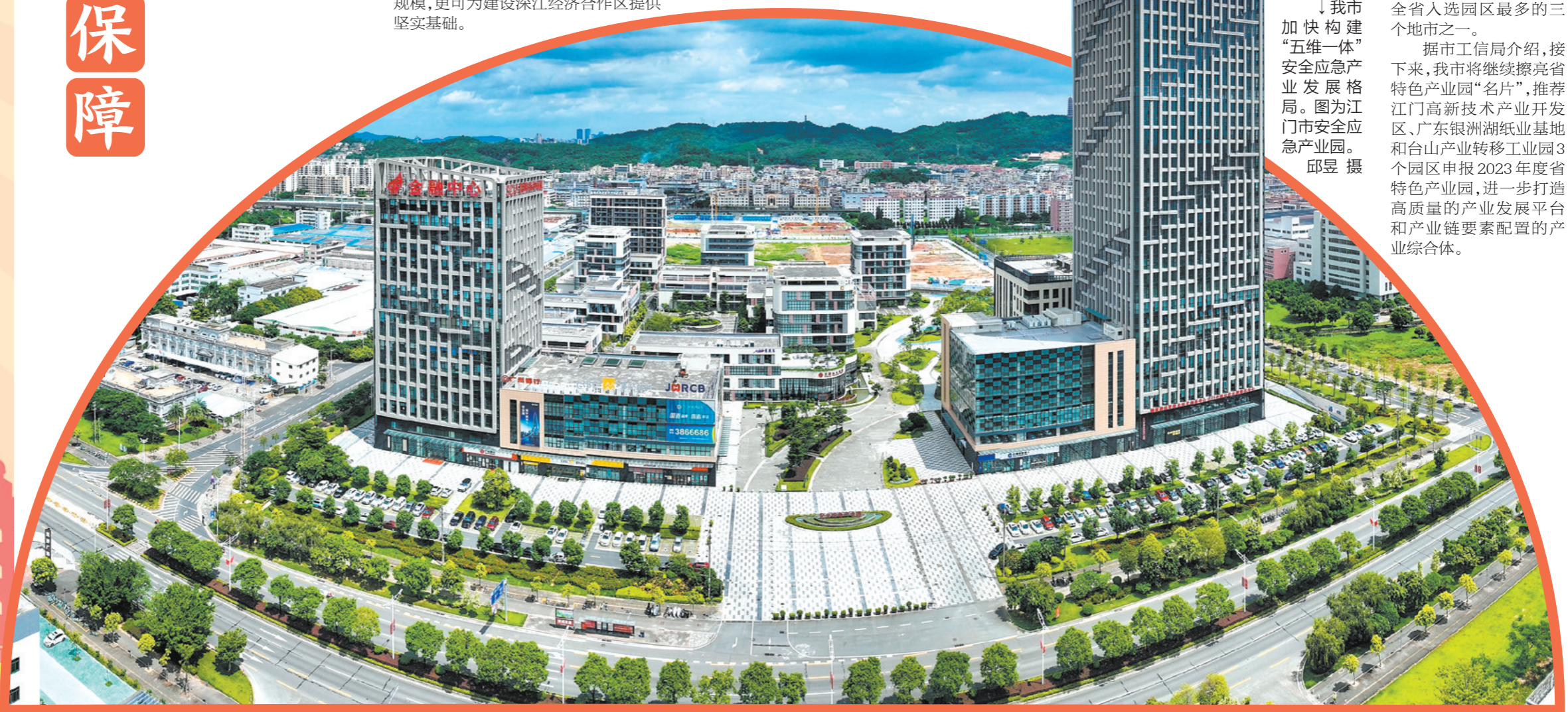
↓我市加快构建“五维一体”安全应急产业发展格局。图为江门市安全应急产业园。