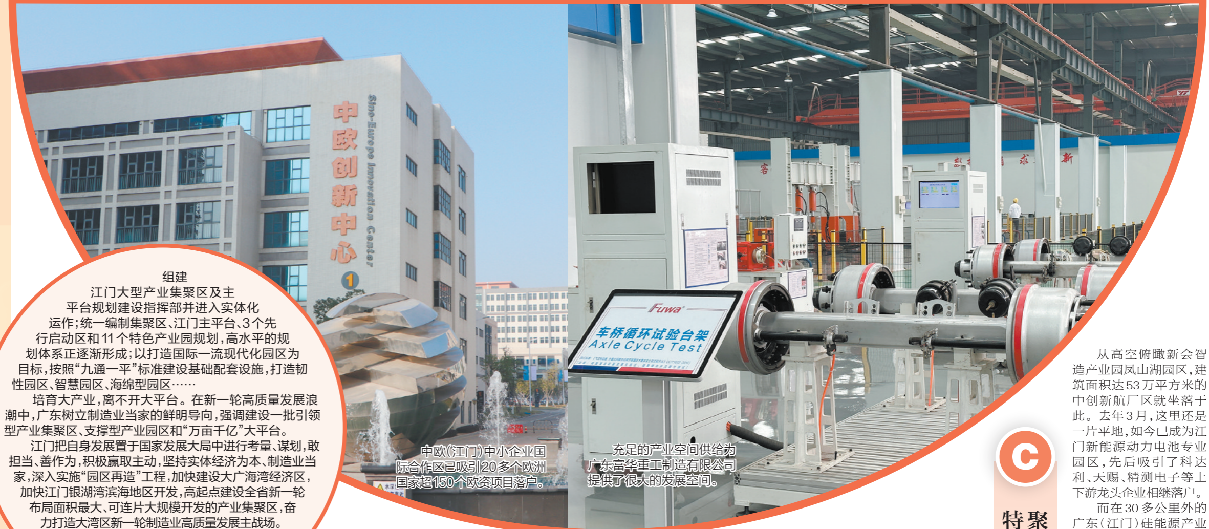
中欧（江门）中小企业国际合作区已吸引20多个欧洲国家超150个欧资项目落户。

据市工信局介绍，接下来，我市将继续擦亮特色产业“名片”，推荐江门高新技术产业开发区、广东银湖湾纸业基地和台山产业转移工业园3个园区申报2023年度省特色产业，进一步打造高质量的产业发展平台和产业链要素配置的产业综合体。