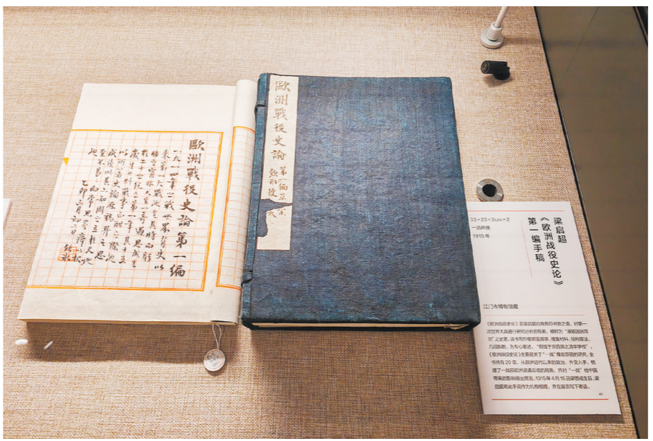
梁启超《欧洲战役史论》手稿目前正在清华大学艺术博物馆的“中国新民:梁启超诞辰150周年纪念展”展出。

【文物名片】 文物名称:梁启超《欧洲战役史论》手稿 文物年份:1914年 馆藏方:江门市博物馆 馆藏地点:中国侨都华侨华人博物馆