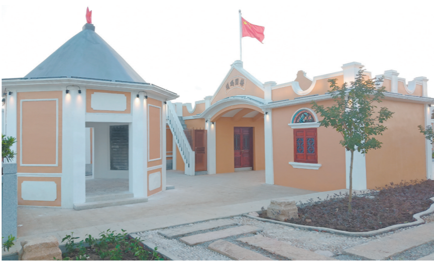
梅阁码头修旧如旧，保留古朴气质的同时，完善了文创旅游功能。

就像当年海内外乡亲筹资建码头一样，90多年后，一封提倡海内外梅阁乡亲、企业家、社会各界朋友捐款修缮梅阁