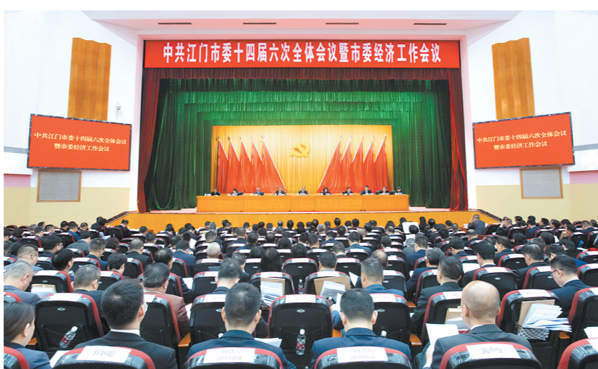
1月8日,中国共产党江门市第十四届委员会第六次全体会议暨市委经济工作会议召开。

会议指出,今年是中华人民共和国成立75周年,是实现“十四五”规划目标任务的关键一年。做好全市工作的总体要求是:以习近平新时代中国特色社会主义思想为指导,全面贯彻党的二十