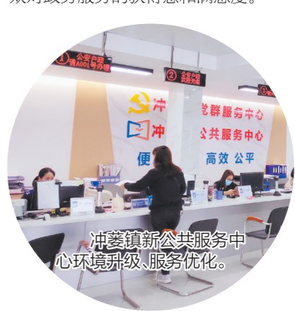
冲蒺镇新公共服务中心环境升级、服务优化。

据悉，下一步，冲蒺镇将继续坚持全心全意为人民服务的宗旨，进一步加强窗口作风建设，提高服务效能，不断优化营商环境和群众办事流程，真正打通服务群众“最后一公里”，着力提升群众对政务服务的获得感和满意度。