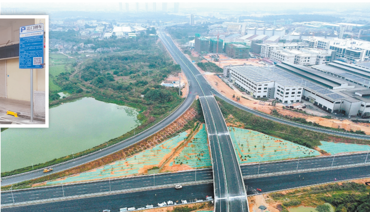
国道G240线台山大江至那金段改扩建工程有序推进，这是“三纵三横”综合交通布局的重要组成部分。