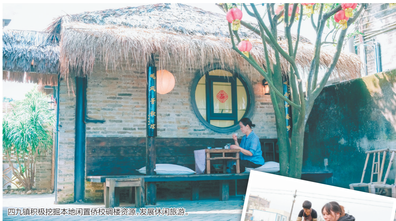
四九镇积极挖掘本地闲置侨校碉楼资源，发展休闲旅游。

在四九镇，不仅地理位置优越的采摘园人山人海，其他位置较为偏远的采摘园同样凭借优质的水果吸引着