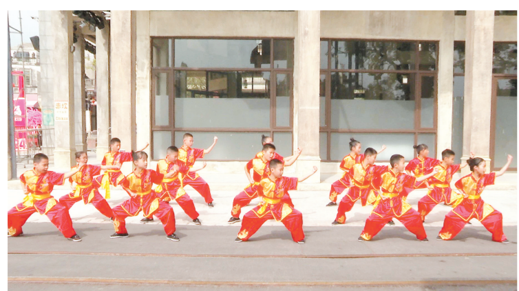
崖门镇黄冲小学的学生将登台表演。

据了解,中国文学艺术界春节大联欢是中国文联的重要品牌活动,是文艺界每年的文化盛会,至今已举办22届,受到社会各界好评。本次大联欢在开平赤坎华侨古镇设置了广东唯一的分会场,将在春节假期期间通过卫视频道和网络平台播出。