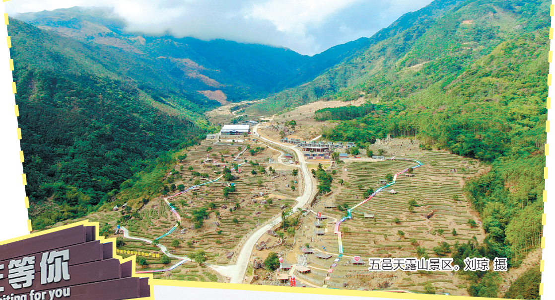
五邑天露山景区。