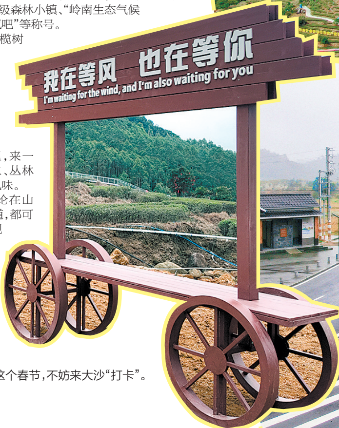
▲这个春节,不妨来大沙“打卡”。