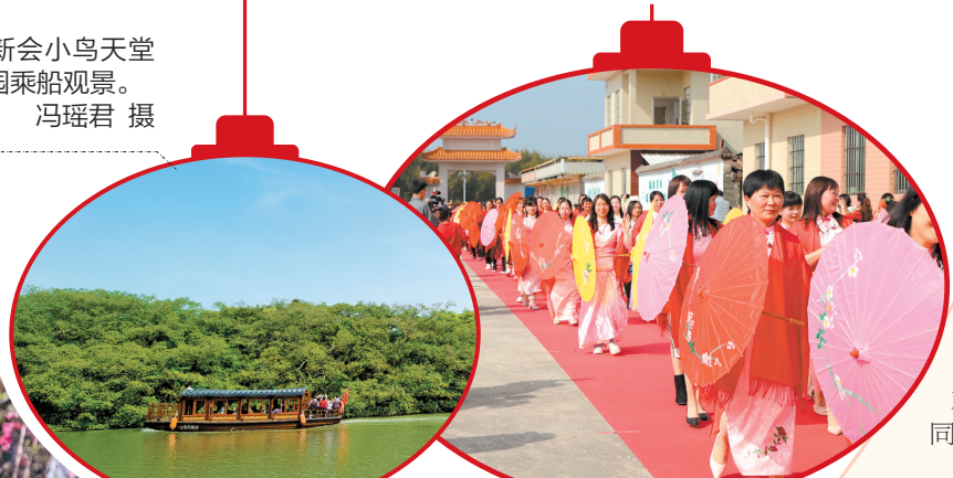
平安村上百名身着盛装的外嫁女回娘家。

江门日报讯(记者/冯瑶君) 阳光、榕树、鹭鸟……2月13日是年初四,新会小鸟天堂国家湿地公园里,一波又一波的游客慕名前来,体验人与自然和谐共生的美好时光。