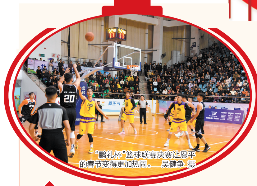
“鹏礼杯”篮球联赛决赛让恩平的春节变得更加热闹。