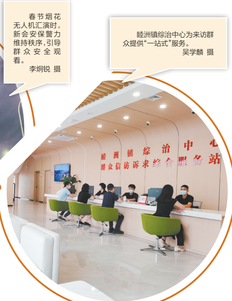
春节烟花无人机汇演时，新会安警警力维持秩序，引导群众安全观看。睦洲镇综治中心为来访群众提供“一站式”服务。

江门日报讯（文/图 记者/任晓盈）为全面了解2024年旅游消费者偏好，深度把握自由市场的未来趋势，近日，马蜂窝发布《2024年春节大数据报告》（以下简称《报告》），其中，位于新会区崖门镇的古兜温泉小镇登上“2024春节假期最受欢迎温泉景点TOP10”榜单，排名第五位。 古兜温泉度假区是国家4A级旅游景区，位于新会区崖门镇古兜山脚下，依山近海，坐拥山、泉、湖、海于一体的自然风光。这里蕴藏着丰富的地热资源，孕育着罕见的咸淡水温泉，经专家评定，是与我国古代名泉华清池为同一性质的温泉水质。 据介绍，《报告》通过热度趋势、热搜关键词、爆款潮酷玩法、用户画像等多维度大数据分析，全方位解析2024年春节旅游的热点、发展态势及旅行人群的行为偏好，并据此作出未来旅行新消费行为和需求的洞察和预测。 《报告》根据热度数据分析：“泡温泉成为一种简单有效的休闲方式，让人们在享受自然美景的同时，也能使得身心得到放松。特别是在寒冷的冬季，温泉旅游更是成为追求健康和休闲生活人士的首选。2024春节假期‘温泉’环比搜索增长201%，热门省份TOP10为云南、广东、江苏、四川、广西、福建、浙江、吉林、河北。其中，最受关注的温泉景点有腾冲热海风景区、天目湖御水温泉、腾冲悦椿温泉村、十大大山布透温泉、古兜温泉小镇等。”