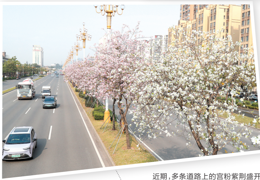
近期,多条道路上的官粉紫荆盛开,让蓬江多了一份浪漫的气息。