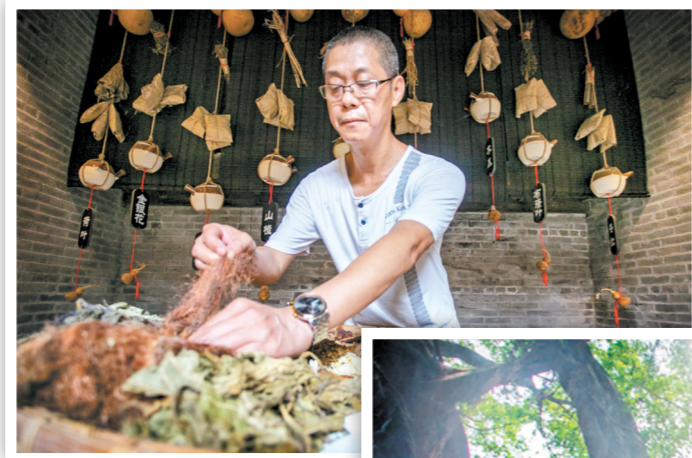
源广和盒仔茶(甘和茶)由28种中草药熬制而成。

岭南自古以来有尚武之风,鹤山亦是如此。鹤山志记载:“明清以来,鹤山县内乡村多设有武馆,师徒授,入馆学者众多,至清末,全县考中武举达20多人,进士4人。”正是在这种尚武风气的熏陶下,梁赞自幼便热爱习武,尤专习咏春拳,得其精髓,且加以创新,遂成一代宗师。