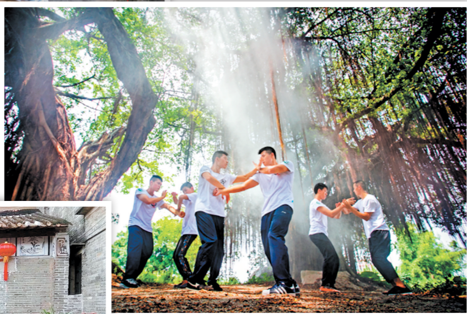
鹤山咏春拳体现的止戈为武、谦恭平和的武德,是鹤山人宝贵的精神财富。