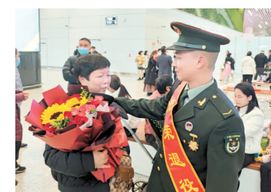
退役军人见到了久违的家人。

江门日报讯(文/图 记者/张舜同 通讯员/赵佳)3月1日,记者跟随鹤山市退役军人事务局、各镇(街)相关工作人员和退役军人家属,前往广州白云国际机场迎接今年春季首批集中退役的鹤山籍退役军人光荣返乡。据悉,这是鹤山市退役军人事务局首次组织退役军人家属一同参加接兵活动,旨在让退役军人更好地感受到家乡的关怀与温暖。