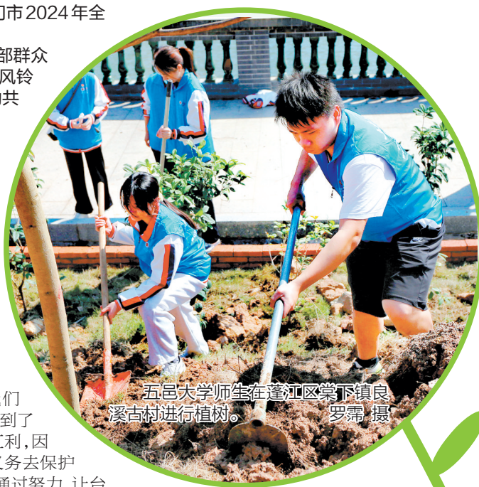
五邑大学师生在蓬江区棠下镇良溪古村进行植树。

据了解,2023年,市林科所被认定为广东省级保障性苗圃和江门市造林苗木定点培育单位,苗圃建