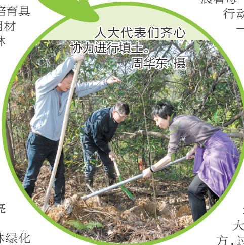
人大代表们齐心协力进行植树。