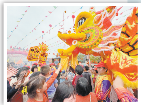
飘色巡游活动吸引海内外乡亲及市民、游客参与。