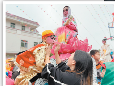
飘色巡游活动开始前,工作人员为色仔化妆。