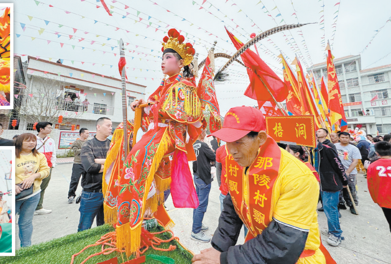
飘色巡游是该村特色传统习俗。