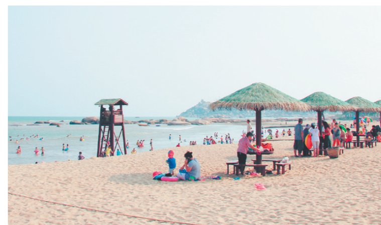
北陡镇旅游资源丰富,每年都吸引大批游客前往。

接下来,北陡镇将继续发挥自身优势,挖掘更多旅游资源,推动旅游产业与农业、文化等深度融合,努力打造更加宜居宜业宜游的滨海小镇。