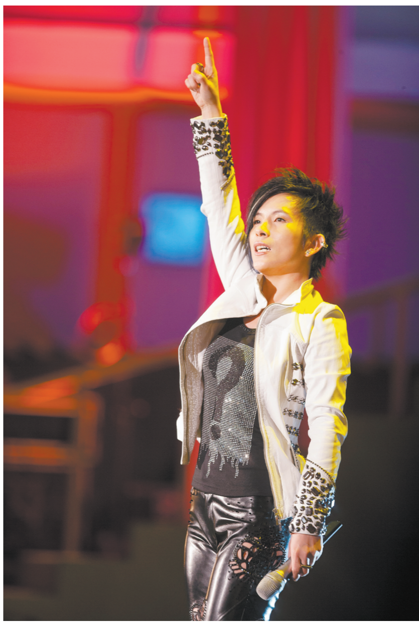
4月20日,潘美辰《回家》2024世界巡回演唱会将在滨江体育中心激情开唱。

同时,江门还是“明星之乡”,诞生了众多影视大咖和100多位影视明星。其中,中国电影先驱黎民伟、著名