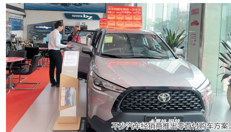
不少汽车经销商推出零首付购车方案。