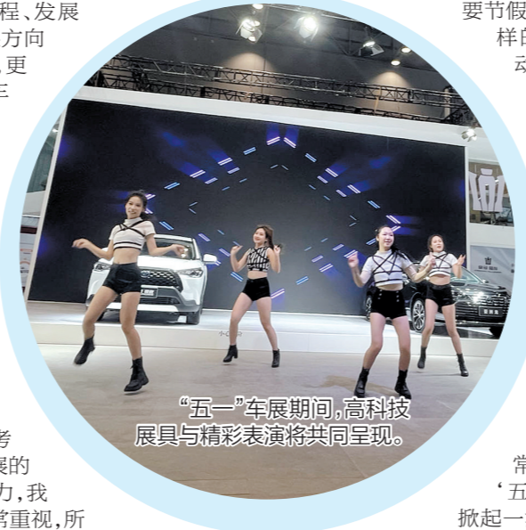
“五一”车展期间,高科技展具与精彩表演将共同呈现。

5月1日—3日,备受瞩目的“五一”车展即将拉开帷幕,有意前来观展、买车的市民可自驾车到达广东珠西国际会展中心,也可乘坐公共交通工具,在江门市区内乘坐61路、55路、32路、22路公交车到江门体育中心公交站下车,然后步行至广东珠西国际会展中心。