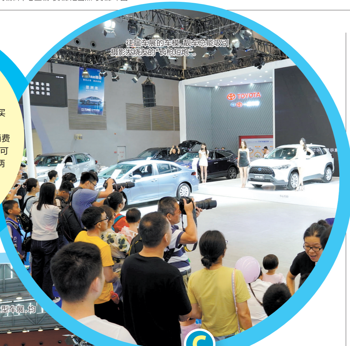
往届本报举办的大型车展,均吸引许多市民的目光。