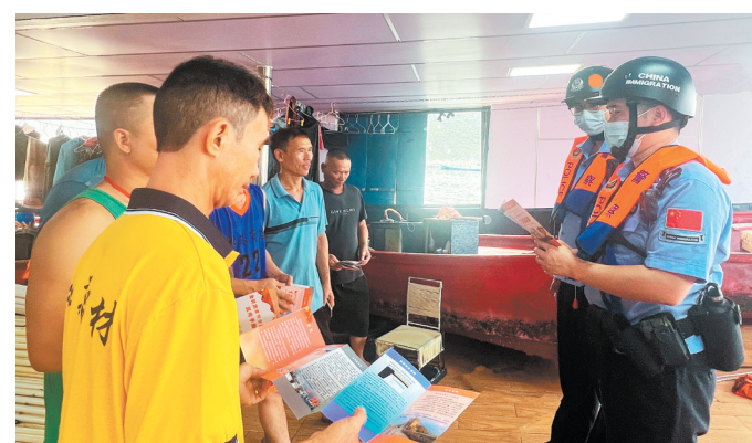
民警通过张贴国家安全宣传海报、发放国家安全知识手册,耐心向群众讲解国家安全法等法律法规。

江门日报讯(文/图 记者/朱磊磊 通讯员/于鑫)近日,珠海边检总站台山边检站民警深入辖区社区、口岸,开展“4·15”全民国家安全教育日系列宣传教育活动。此次活动共发放了宣传册30余份,解答咨询问题10余次,受教育群众达100余人。