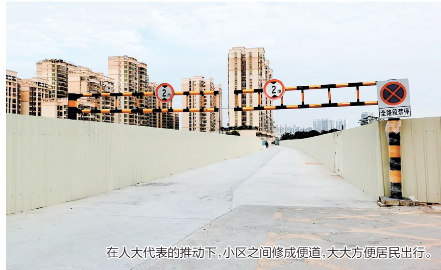
在人大代表的推动下,小区之间修成便道,大大方便居民出行。

会城街道碧桂园片区人大代表联络站现有驻站代表11名,联系网格覆盖范围包括碧桂园社区、民和社区、贤洲社区、今古洲社区、梅江村、城南村等村(社区)。今年年初,碧桂园片区人大代表联络站迎来了一批客人,他们是民和社区