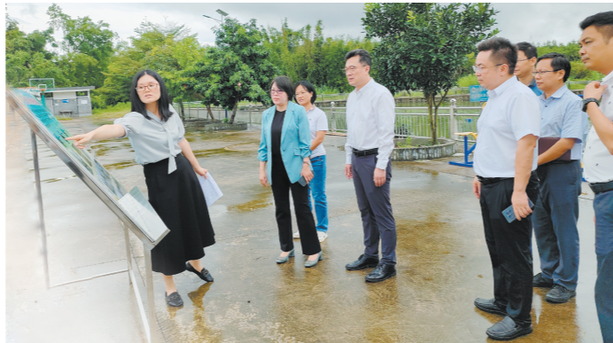
五邑大学党委书记梁天罡(左四)到恩平市对接、调研“双百行动”工作。