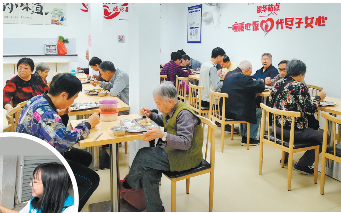
←我市民政局老年人最关心最直接的吃饭问题，深化发展老年助餐服务，主题教育开展以来新增长者饭堂(含助餐服务点)48家。图为老年人在长者饭堂就餐。

江门是一座老龄化程度较高的城市，我市民政局努力构建更高质量的养老服务体系。江门全市备案运营的养老机构83家，11家获评省星级养老机构，1家获民政部表彰为全国养老服务先进单位。此外，我市民政局积极发展居家社区养老服