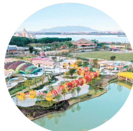
2023年3月，古劳镇获评广东省2022年度休闲农业与乡村旅游示范镇。图为华侨城古劳水乡景区。

成功入选省级休闲农业与乡村旅游示范镇、推动华侨城古劳水乡项目成功申报国家4A级景区、鹤山市首个景区党群服务中心落成……古劳镇位于鹤山市东北部，毗邻西江河畔，是一个美丽的岭南水乡，被誉为“东方威尼斯”。随着粤港澳大湾区建设深入推进，古劳镇也因优越的宜居宜业宜游环境，成为大湾区休闲旅游的优选地。