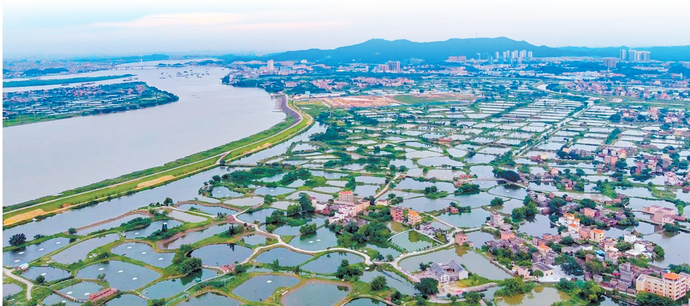
良田阡陌错落,大小鱼塘各自成围。鹤山市古劳镇遍布着岭南地区规模最大、保存最完整的桑基鱼塘农业生产系统,独特壮美的棋盘式围墩地貌寄托着人们对幸福生活的向往。