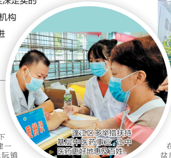
蓬江区多措并举扶持基层中医药事业，让中医药更好地惠及百姓。