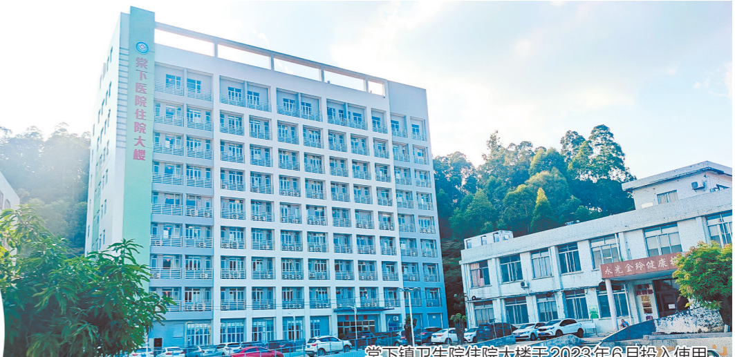
棠下镇卫生院住院大楼于2023年6月投入使用。