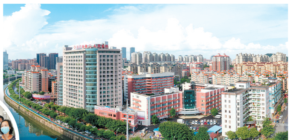
江门市中心医院与蓬江分院的医联体建设更好保障蓬江居民的生命健康安全。