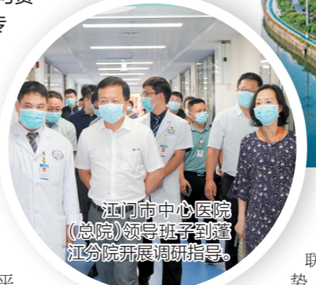
江门市中心医院（总院）领导班子到蓬江分院开展调研指导。