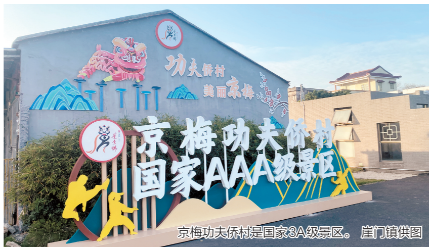
京梅功夫村是国家3A级景区。崖门镇供图