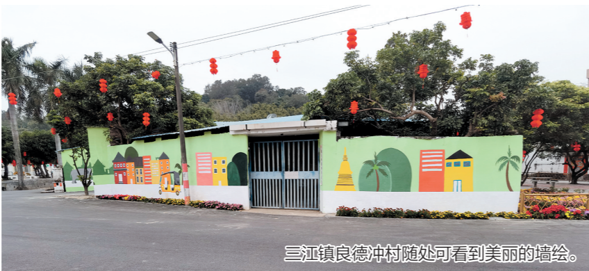
三江镇良德冲村随处可见美丽的墙绘。