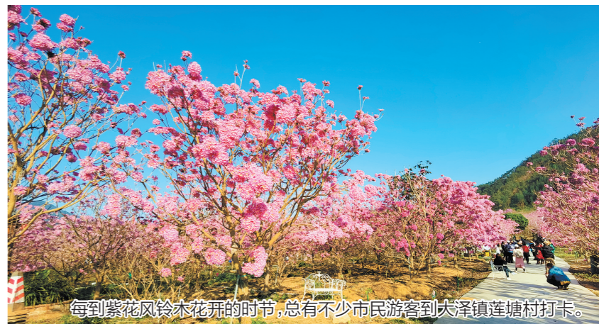
每到紫花风铃木花开的时节，总有不少市民游客到大泽镇莲塘村打卡。