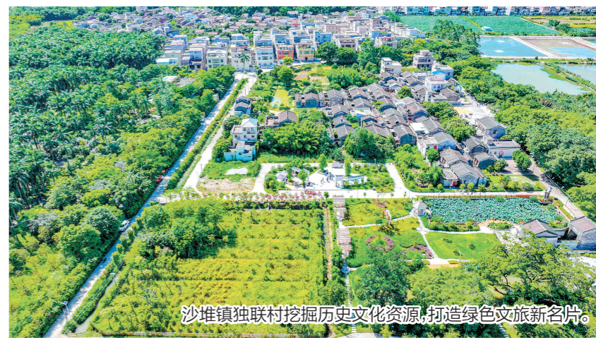
沙堆镇独联村挖掘历史文化资源，打造绿色文旅新名片。