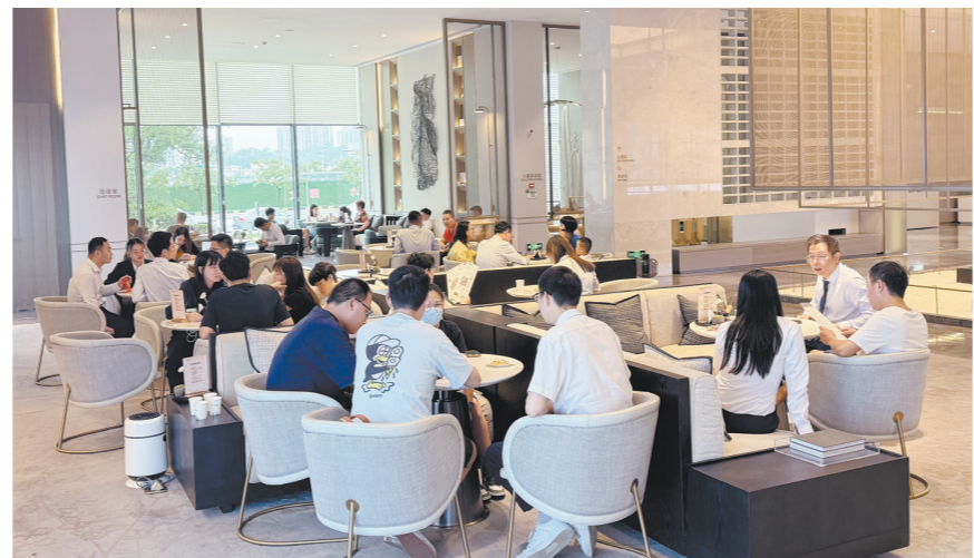
“五一”假期,蓬江区各楼盘人气十足。区住建局相关负责人表示,随着房地产供需两端政策持续优化调整,市场信心将进一步提振。未来,蓬江区将继续在满足人民群众美好生活需要及促进房地产业平稳健康发展上下功夫。

美食市集、魔术表演、手工美食DIY……记者深入蓬江区各楼盘走访发现,“五一”假期,各楼盘营销活动不断,人气十足:在粤海城,音乐集市在江岸举行,带旺了人气;在博学名苑,有多个趣味互动摊位和精美美食摊位,好吃、好玩、好礼,惊喜不断;在江发中交·悦山湖,荷塘首届大型皇家魔术杂技狂欢节举行,带来了皇家杂技秀、物理大实验及大型魔术秀等大型表演。与此同时,各楼盘的促销优惠措施同样给力,包括限定折扣、赠送家车位、限定名额送物业费、购房补贴、砸金蛋赢豪礼等。比如,江发·滨江名院推出“购房秒杀超笋一口价”活动,消费者购买指定房源即送人防