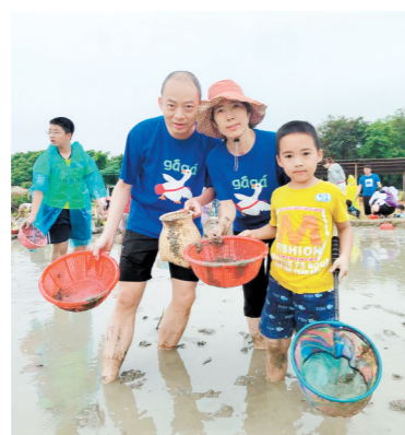
今年“五一”假期，许多游客到双合镇享受“农趣”。