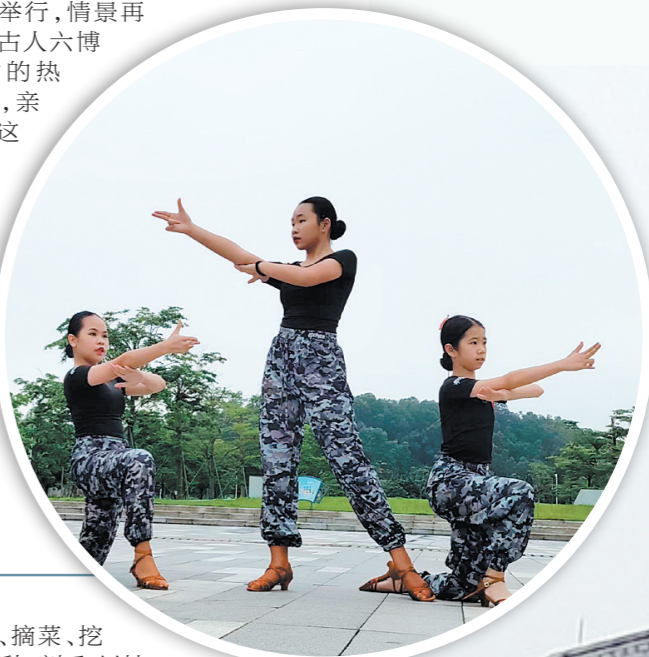
鹤山“强国复兴有我”暨“五一”文艺快闪在鹤山文化中心广场精彩上演，青少年用激情舞蹈展示积极向上的面貌。

“寻宝记活动”和六博游戏在鹤山市博物馆快乐启动。“寻宝记活动”里面展示各种标记着鹤山变迁的物品，不仅让老街坊忆旧时，也让年轻的新一代了解鹤山的过去与变化。六博游戏在馆外中庭石雕棋盘举行，情景再现旧时古人六博对弈时的热闹场景，亲身感受这款历经千年的古代桌游。