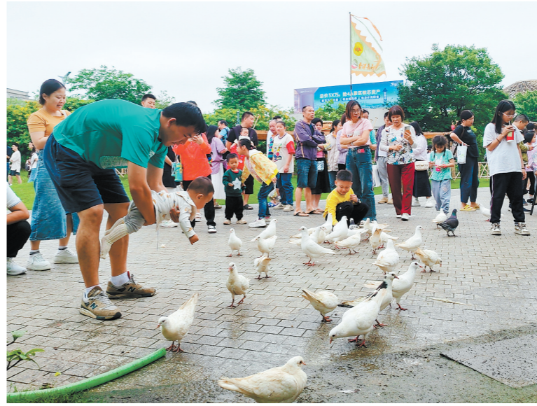
古劳水乡旅游区在“五一”假期精心策划了丰富活动。

值得一提的是，趁着“五一”假期，市民也开启“买买买”模式。鹤山市各大商业综合体纷纷抓住节庆商机，推出多品类、多形式的促销活动，鹤山新华城举办“五一悦购节”、假日音乐节，Live band现场驻唱。一汇新天地举办“快乐工作，快乐生活”主题消费日活动，市场呈现购销两旺景象。