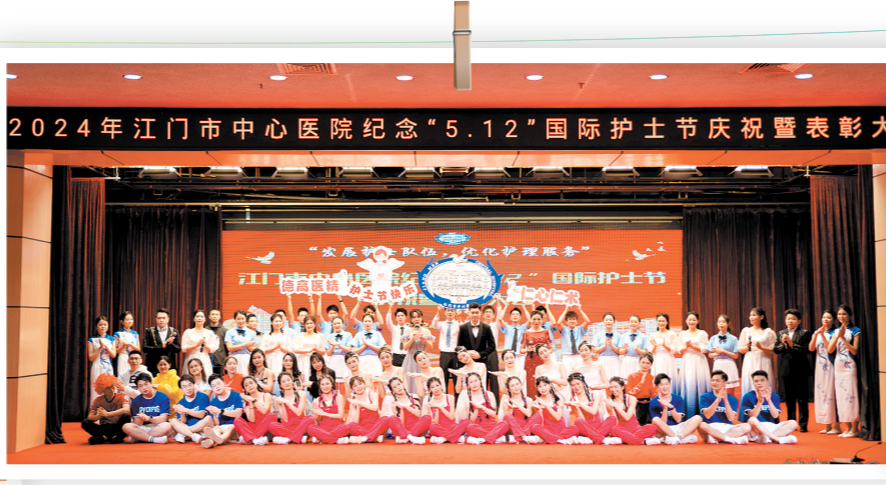
江门市中心医院举办2024年纪念“5·12”国际护士节庆祝暨表彰大会。