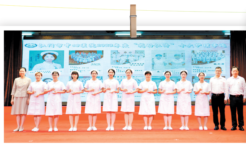
为“感动仁济十大护理事迹”获奖者颁奖。