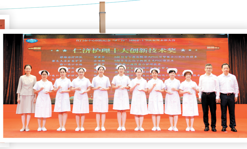
为“仁济护理十大创新技术奖”获奖者颁奖。