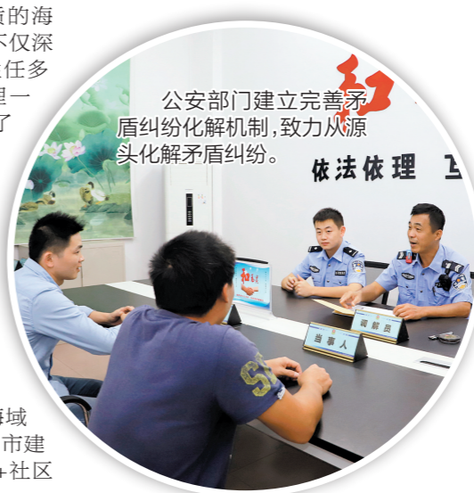
公安部门建立完善矛盾纠纷化解机制,致力从源头化解矛盾纠纷。

台山市的“三颗真心”服务模式在实践中不断得到验证和完善,显著提升了基层社会治理效能和水平,让广大群众真切感受到党委政府的温暖和关怀,为构建和谐社会注入了新的活力。