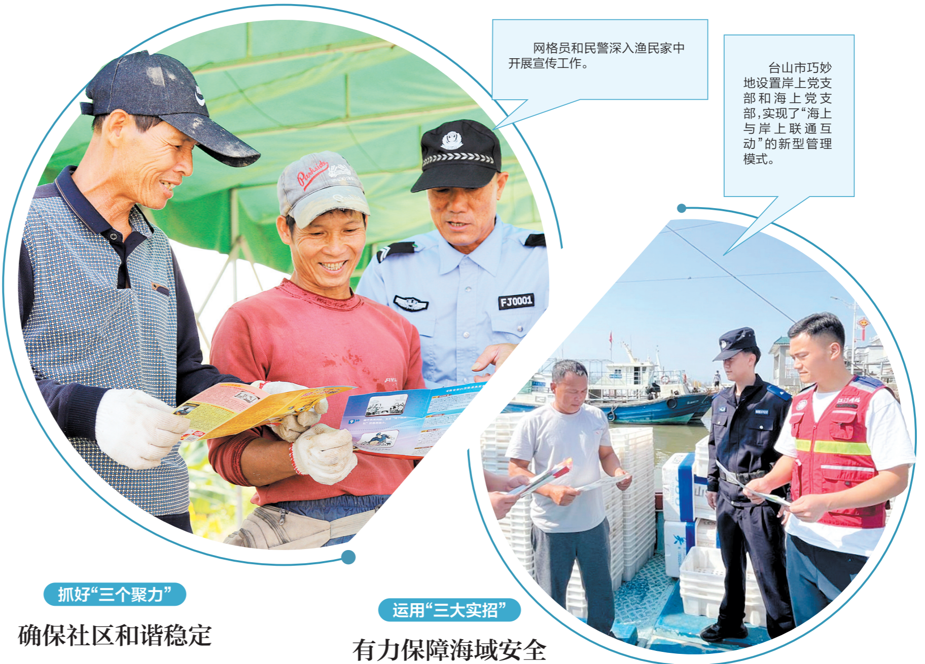
网格员和民警深入渔民家中开展宣传工作。