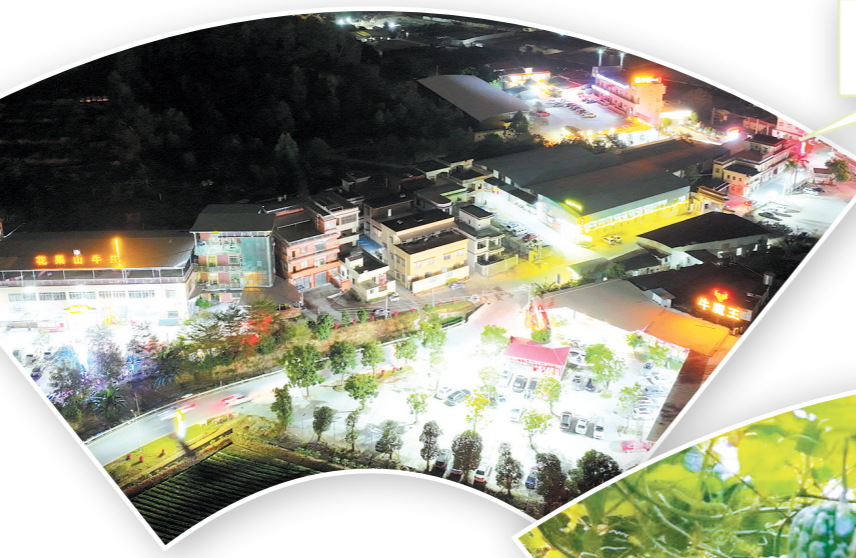
如今，五洞牛肉美食街已成为网红打卡点。

此外，五洞村深入实施村容村貌提升工程，助推乡村文旅产业发展。以五洞牛肉美食街为主轴，积极发动党员、村民沿路拆旧补绿、清除杂物，利用墙绘美化农房，增设交通标识，修整