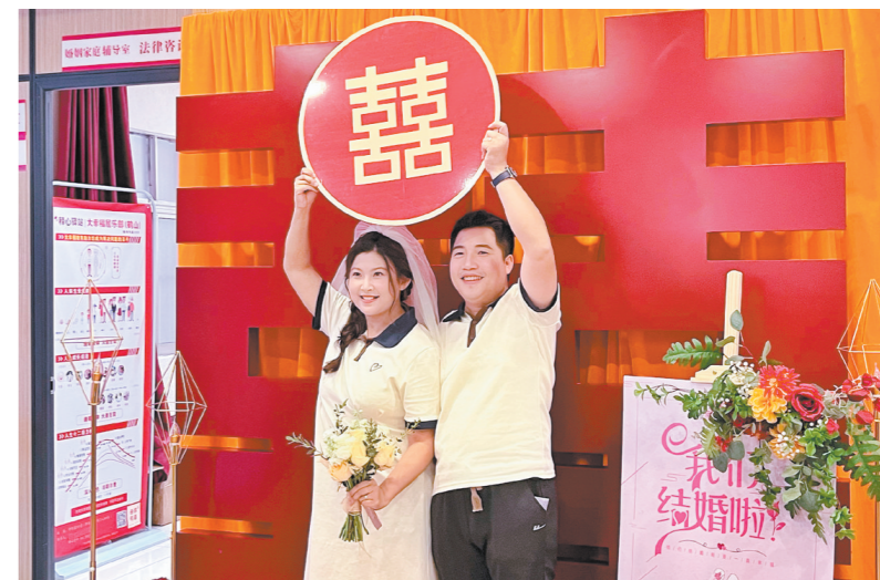
领取结婚证后，新人拍照留念。

“‘520’前来登记结婚的人数比平时明显增多，我们通过提前开通网上预约登记、现场安排志愿者服务、工作人员提前到岗和延时下班等措施，全力满足新人们的登记需求。”鹤山市民政局婚姻登记处负责人表示。