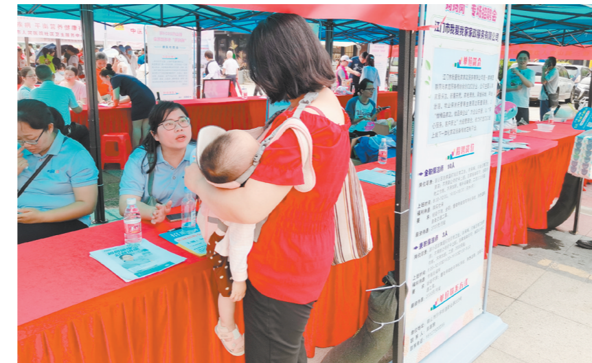
本次招聘会为妈妈们提供“家门口”的就业岗位。

下一步，鹤山市将精心打造“妈妈岗”灵活就业服务品牌，充分发挥辖区就业驿站的辐射带动作用，进一步促进妇女灵活就业，持续为她们提供更多“家门口”的就业岗位，有效实现妇女就业、企业用工、家庭照护的“三赢”，把“妈妈岗”变成“妈妈港”。