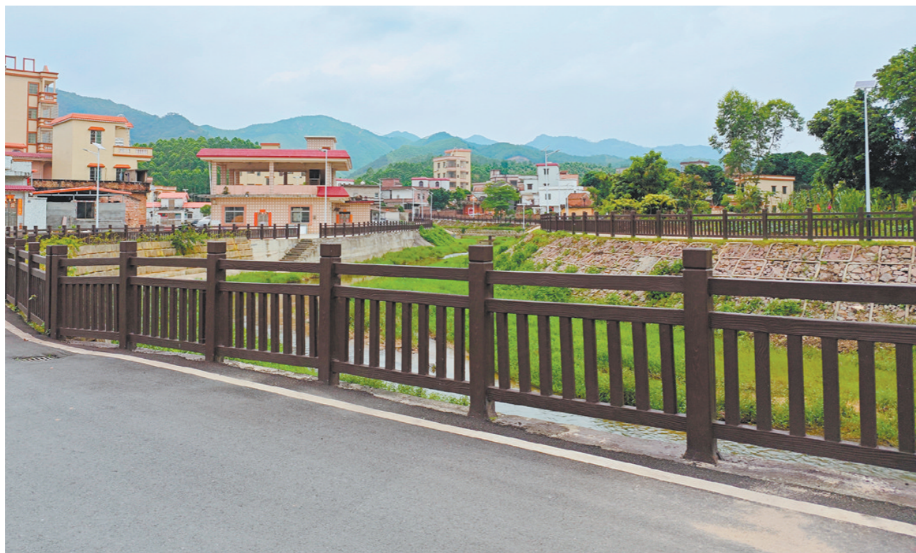
福迳村大力开展河道整治，美化村庄环境。