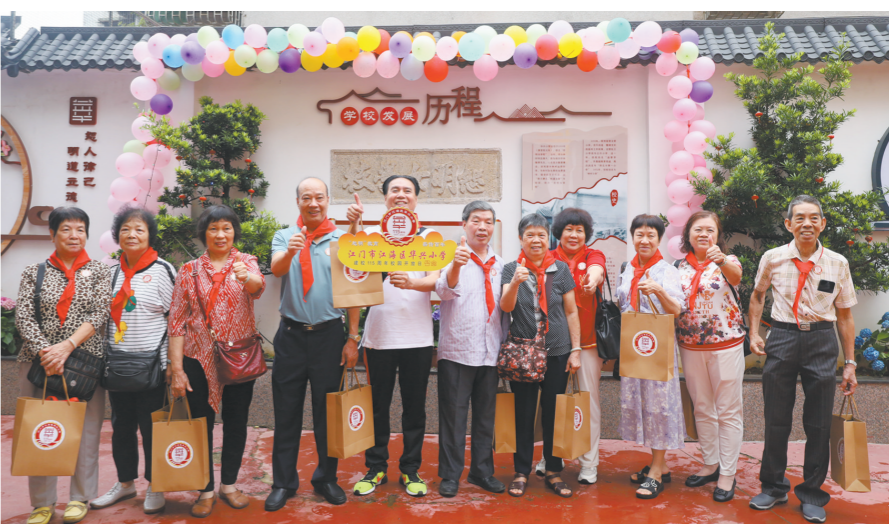
↑各届校友“回家”庆贺母校建校115周年。 ←大家齐唱歌曲，为母校庆生。