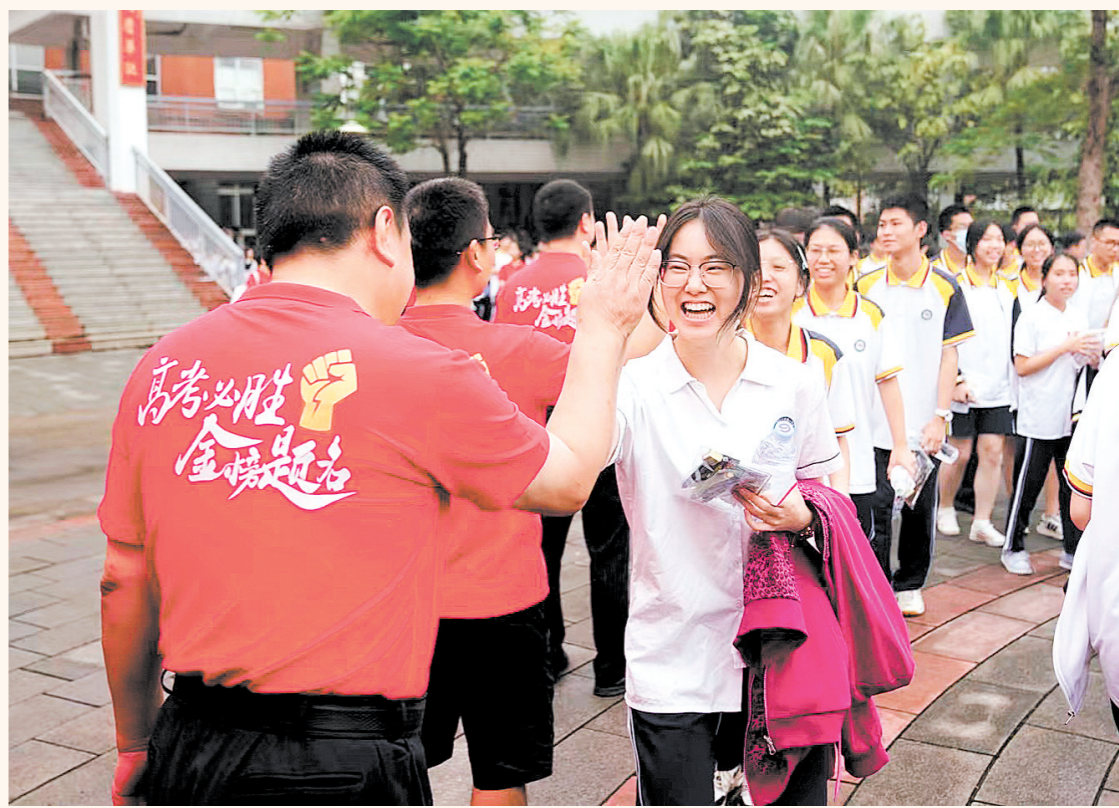
昨日上午,在江门一中考点,考生面带笑容,与老师击掌后信心满满地赴考。

送考“战袍”饱含浓浓祝福 | 吉祥“粽子”成“团宠” | 护航“天团”暖心服务获点赞