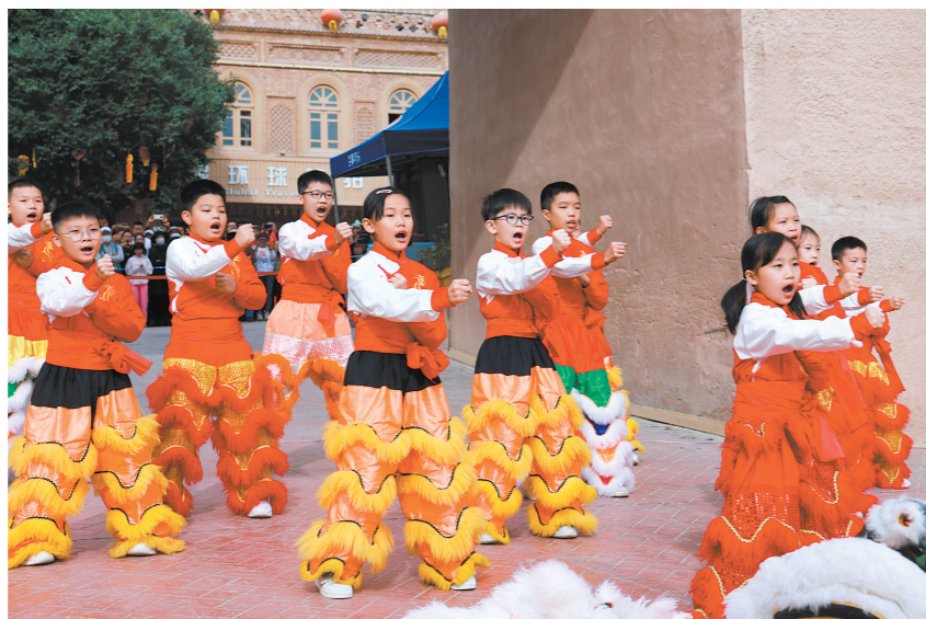
江门“小醒狮”在喀什古城表演醒狮和咏春拳,推广“江门3.3精彩之旅”。

跟随江门“小醒狮”一起前往新疆的,还有来自江门各地的优质特产,比如新会陈皮、荔枝、鹤山红茶等。不仅如此,江门鹤山龙舟队代表从6月27日至今在新疆为当地的龙舟选手提供为