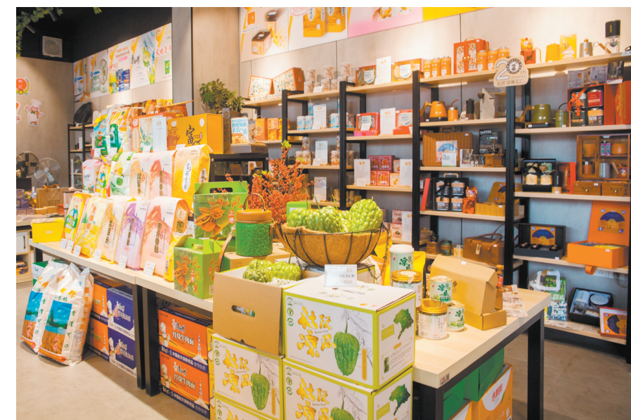
“蓬江优品”线下直营店商品琳琅满目。

走进长堤文化历史街区的“蓬江优品”青年广场店,琳琅满目的特色农副产品和智能家电映入眼帘。杜阮凉瓜、荷塘冲菜、丰富粮油等蓬江农产品,彰显了蓬江区实体经济的强劲实力。今年以来,蓬江区深入推进“百千万工程”,创新区域品牌建设模式,全力打造“蓬江优品”。通过政府主导,推动“蓬江优品”青年广场店、常安新百货两家区级线下直营店开业运营,拓宽农副产品销路。经过严格筛选,首批“蓬江优品”产品名库应运而生,涵盖特色初级农产品、食品类及工业类产品,带动全域农产品品牌发展,助力农民增收致富,为乡村振兴和蓬江区高质量发展注入新活力。