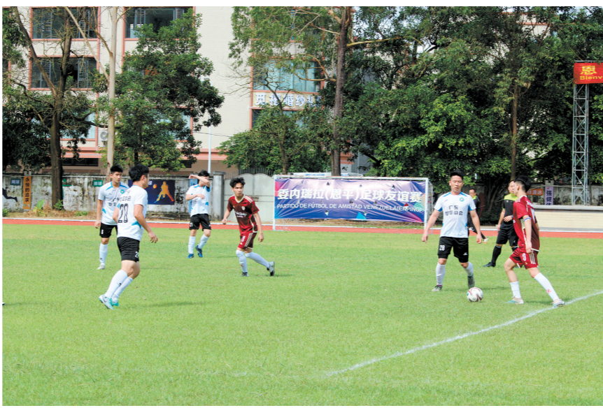
球员们在赛场上尽情奔跑,双方啦啦队激情欢呼,西班牙语与恩平话交织赛场。

未来,恩平市将不断丰富中委文化交流,搭建恩平与委内瑞拉的文化交流平台,增进双方文化互鉴互赏;加大创新创作力度,将中委两国文化艺术元素融