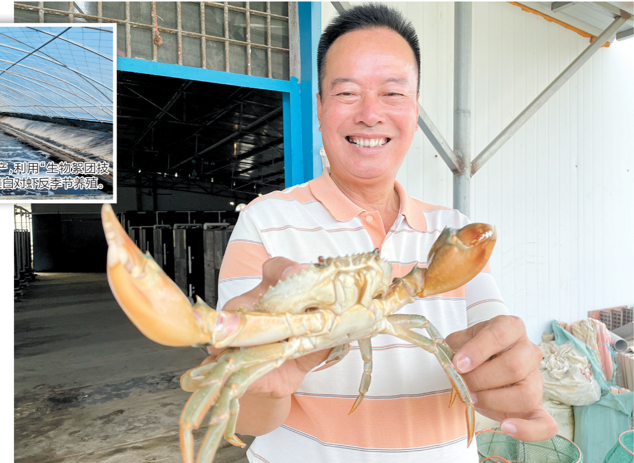
蓝田村依托蓝田青蟹养殖基地,以“党支部+公司+农户”模式,探索咸、淡水养殖青蟹的发展之路。

蓝田村原本是一个没有专业化养殖手段和便利交通运输条件的养殖小村。该村充分发挥党建引领作用,利用数百亩咸围的有利条件,依托蓝田青蟹养殖基地,以“党支部+公司+农户”模式,探索咸、淡水养殖青蟹的发展之路。自此,该村的青蟹养殖技术和产量有了飞速提升。该村积极引进澳门归侨人才,成立广东蓝田农业科技发展有限公司,并与宁波大学、仲恺农业工程学院等多家高校进行产学研合作,推动由单一青蟹养殖逐步向集育苗育种、旅游观光、科研于一体的综合性现代化农业养殖业转型发展。