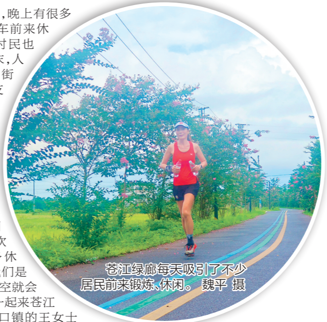
苍江绿廊每天吸引了不少居民前来锻炼、休闲。

极目即是绿,眼目都是景,不必长途跋涉,近在眼前的景色同样如画动人。碧波与绿廊相伴,草木葱茏、鸟语花香。在风和日丽的周末,市民和游客喜欢到苍江绿廊健身休闲、赏花遛娃。“我们是这里的常客,一有空就会和朋友带上小孩一起来苍江绿廊玩。”家住水口镇的王女士