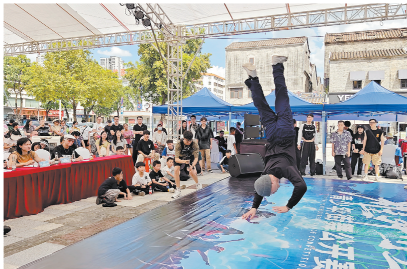
街舞比赛现场。

江门,这座充满活力的城市,正紧紧抓住这一契机,让街舞文化在这片土地上绽放出绚烂的花朵。