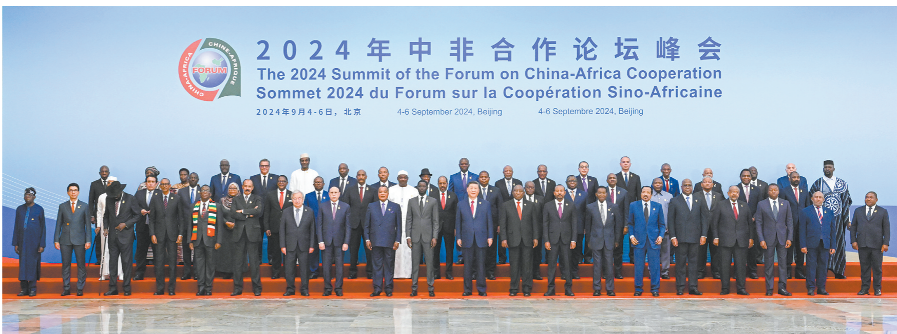
9月5日上午,国家主席习近平在北京人民大会堂出席中非合作论坛北京峰会开幕式并发表主旨讲话。这是开幕式前,习近平同出席峰会的外方领导人集体合影。

新华社北京9月5日电 9月5日上午,国家主席习近平在北京人民大会堂出席中非合作论坛北京峰会开幕式并发表主旨讲话。习近平宣布,中国同所有非洲建交国的双边关系提升到战略关系层面,中非关系整体定位提升至新时代全天候中非命运共同体,将实施中非携手推进现代化十大伙伴行动。 中共中央政治局常委李强、赵乐际、王沪宁、蔡奇、丁薛祥、李希出席。 初秋北京,高远澄明。天安门广场和长安街两侧,鲜艳的五星红旗同53个非洲国家和非洲联盟旗帜迎风飘扬。 习近平同出席峰会的51位非洲国家元首、政府首脑以及2位总统代表、非盟委员会主席和联合国秘书长集体合影。 在《和平——命运共同体》乐曲和热烈掌声中,习近平同外方领导人共同步入会场,在主席台就座。