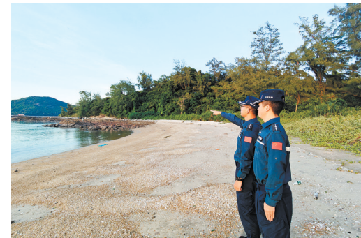
执法员巡查无人海岛。

江门海警局温馨提醒广大游客,未经审批非法组织“无人岛”旅游属违法行为。且“无人岛”非法旅游存在安全隐患,一旦发生安全事故,人身安全和合法权益无法得到保障,请广大游客严格遵守法规,不要跟随不良商家参与“无人岛”旅游。