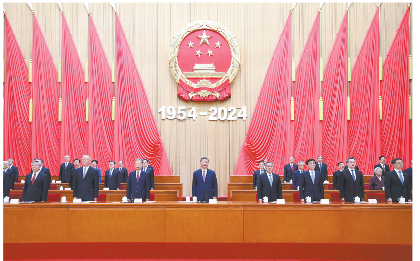
9月14日上午,中共中央、全国人大常委会在北京人民大会堂隆重举行庆祝全国人民代表大会成立70周年大会。中共中央总书记、国家主席、中央军委主席习近平出席会议并发表重要讲话。