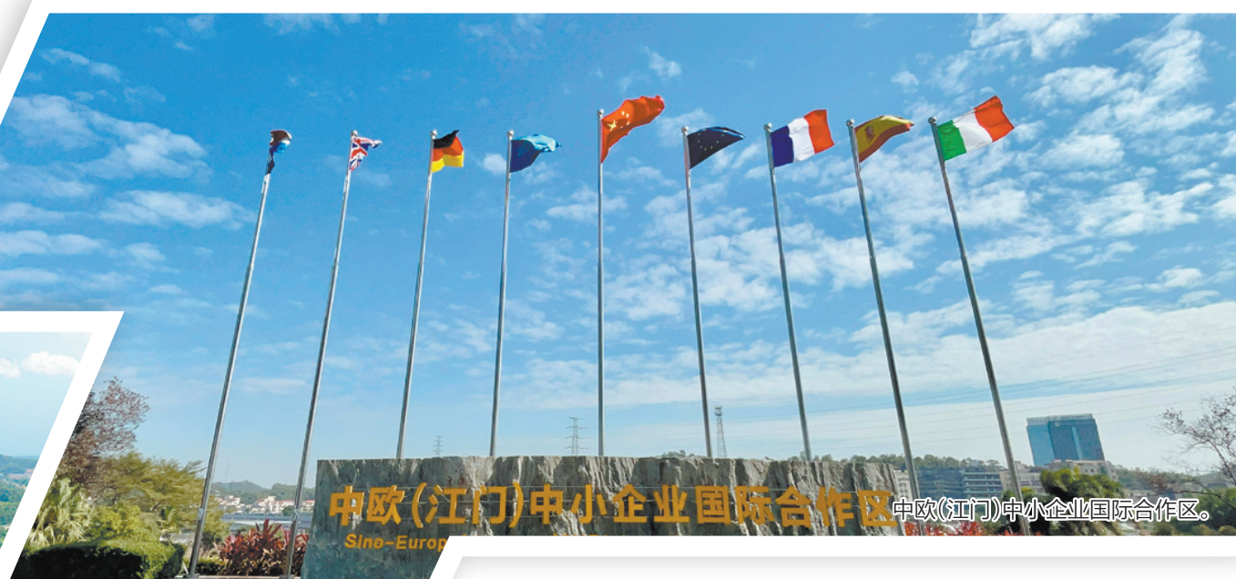
中欧(江门)中小企业国际合作区