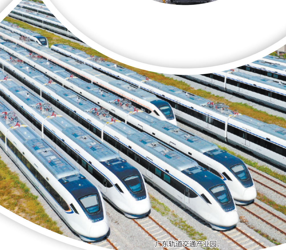
广东轨道交通产业园。