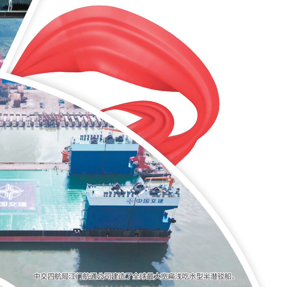
中交四航局江门航运公司建了全球最大宽扁浅吃水型半潜驳船。

2021年,江门提出“园区再造”工程,谋划北东、南三大组团高标准推进江门大型产业集聚区建设,其中北组团主攻中欧合作,建设中国—东盟(江门)中小企业国际合作区;东