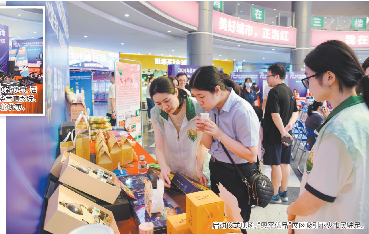
启动仪式现场,“恩平优品”展区吸引不少市民驻足。

欢乐买买买,优惠享不停!9月15日上午,2024年恩平市消费品以旧换新行动暨“乐购恩平·中秋国庆专场”消费促进月活动启动仪式在锦江国际广场举行。活动现场发布购房补贴、汽车以旧换新优惠、消费折扣等一系列福利,涵盖房地产、汽车、家电、超市、餐饮、景区、银行、特色农产品、电器器材等多个领域,开启新一轮消费盛宴。