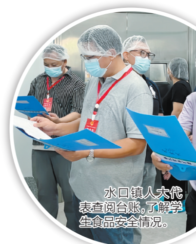
水口镇人大代表查阅台账,了解学生食品安全情况。

实地检查、听取汇报、查阅台账等方式,详细了解学生午餐食品原材料采购贮存、检测、清洗、制作全过程和餐具清洗消毒、打包配送等情况,督促相关负责人严格落实主体责任,确保食材新鲜、烹饪得当、营养均衡、就餐场所整洁卫生。