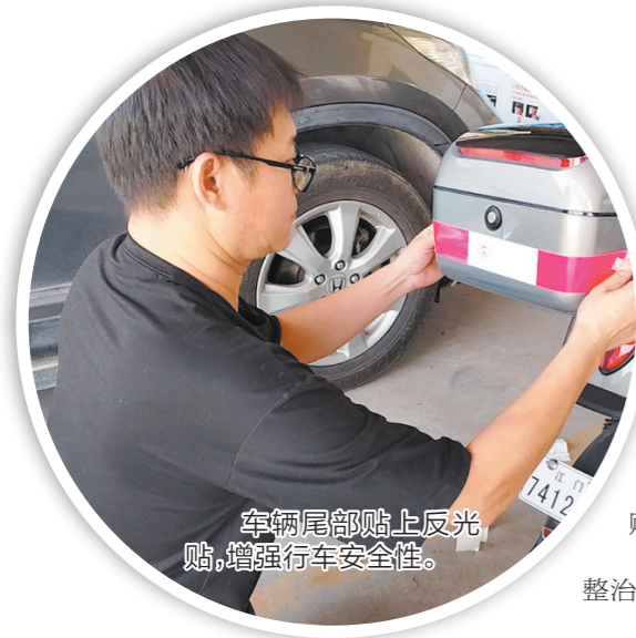
车辆尾部贴上反光贴,增强行车安全性。

江门日报讯(文/图 记者/张华帆 通讯员/梁健赞)“贴这个反光贴,夜晚行车时别人就能看到,这样你也安全,别人也安全。”昨日,一名车主告诉记者。在蚬冈镇道路上,经常能看到摩托车、电动自行车等车辆上贴有醒目的反光贴。