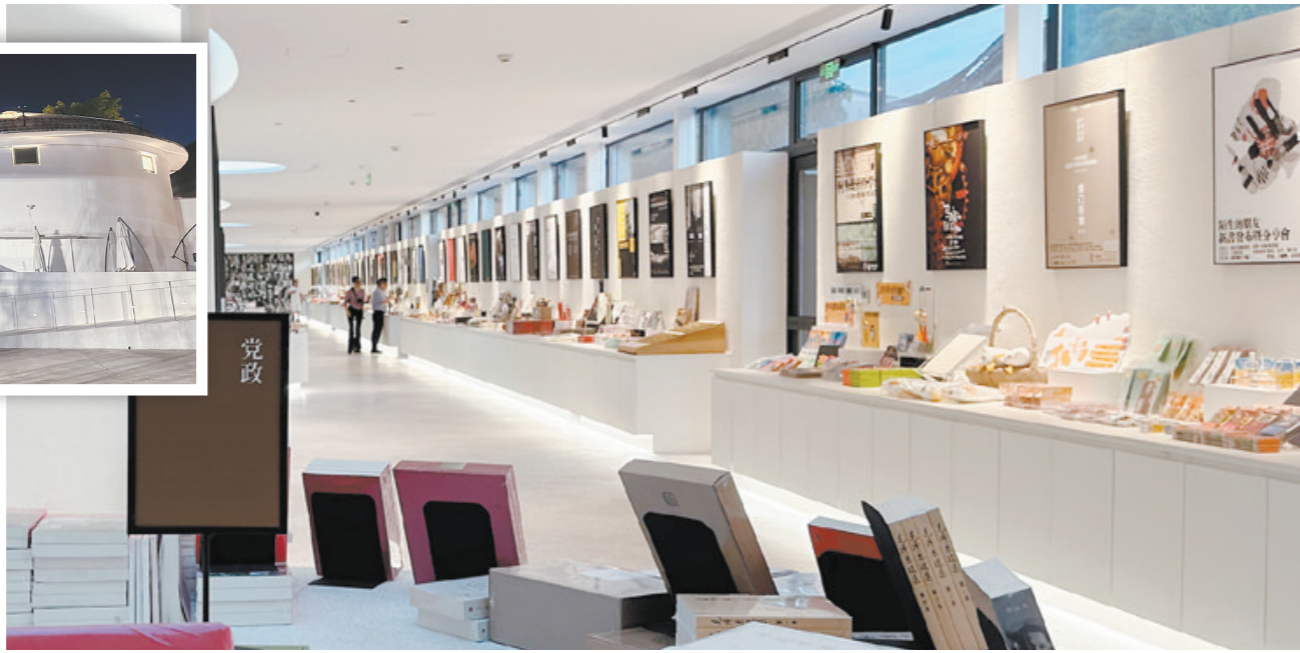
先锋天下粮仓书店展廊既可以作为文创展销平台,又可以定期举办各式展览。

江门日报讯(文/图 记者/张华帆)近日,在广州举办的2024年“粤式新潮流”广东文旅消费新业态热门场景推介交流会上,省文化和旅游厅正式公布了第二批“粤式新潮流”广东文旅消费新业态热门场景名单,其中江门开平塘口镇先锋天下粮仓书店入选“文博艺术”类名单。