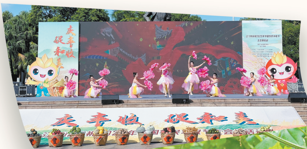
▲我市连续多年举办相关庆祝活动，引导群众听党话、感党恩、跟党走，“农”墨重彩绘就乡村“丰”景图。