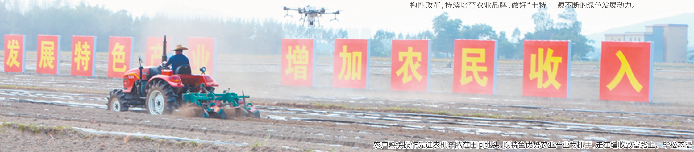
农户熟练操作先进农机驰骋在田间地头，以特色优势农业产业为抓手，走在增收致富路上。

用于销售江门“土特产”、对口帮扶地区产品，打造“丰收集市”促进市场消费，打造电商直播带货矩阵，设置电商直播专区展位8个，由农技驿站以及自发参加活动的7家农业保险公司联合11家电商企业开展直播带货。 三是“送丰收”零距离服务活动，活动当天开展送技术、送法律、送种子等服务活动，主要面向群众展示农产品质量安全检测技术，开展农产品质量安全法等普法宣传活动，赠送丝苗米等新种子。 四是“赞丰收”宣传活动，在庆丰收的宣传报道中展示农业产业发展喜人成绩、农村面貌喜人变化、农民生活喜人景象。 五是“乐丰收”趣味活动，现场同步开展与“三农”相关的趣味活动，发放赠品，吸引广大市民群众参与，共享丰收欢乐。