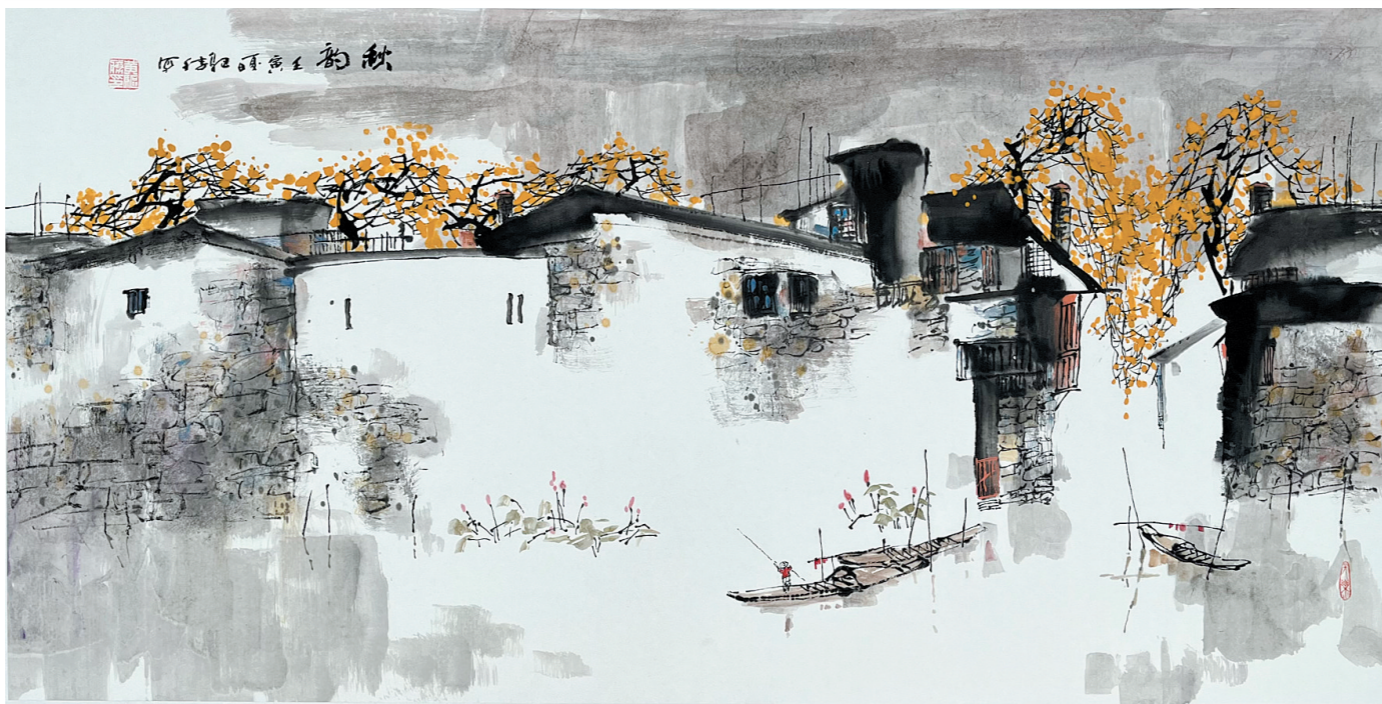
中国画《秋韵》(68x136cm) 黄驱胜 绘

当我们站在秋分的门槛上，回望过去，展望未来，是不是也能像这节气的名字一样，将自己的“人生平分秋色”，一半用于沉淀，一半用于前行？让我们在秋分之际，用心感受自然的节拍，以一颗勤劳的心去收获属于自己的那份金黄。当金黄的叶子轻轻落下，我们不妨拾起一片，感知岁月的温柔，也感受生命的丰盛。