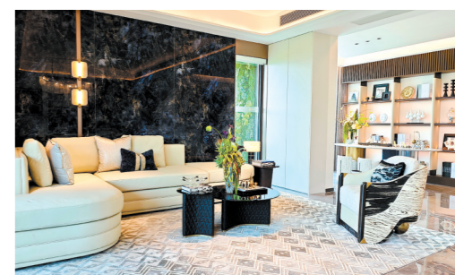
江发·翡翠观澜样板房实景图。

10月1日，江发·翡翠观澜精心打磨的会所“观澜荟”及6栋实景样板房正式对外开放。活动当天，江发·翡翠观澜还举行了品牌商家联盟签约和主题为“江门封面 大美观澜”的江发·翡翠观澜首届城市封面摄影大赛启动仪式。