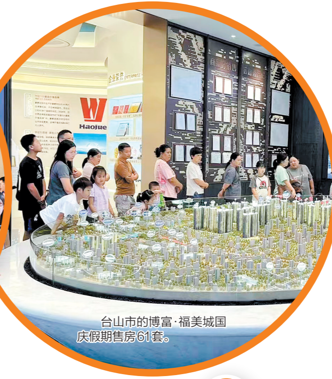
台山市的博富·福美城国庆假期售房61套。