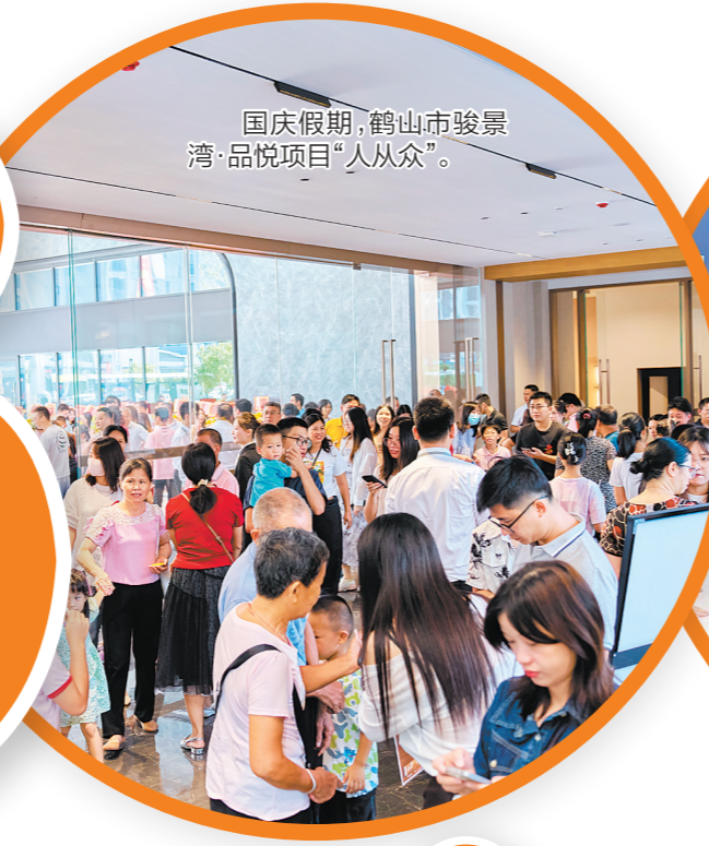
国庆假期，鹤山市骏景湾·品悦项目“人从众”。