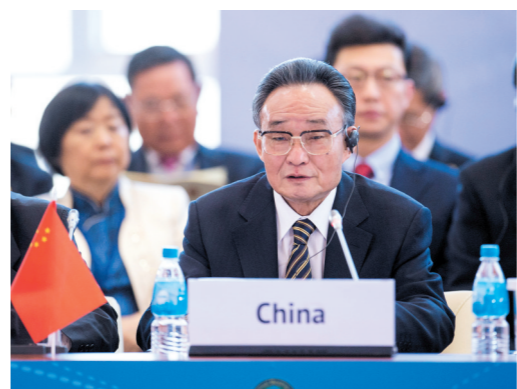
2013年1月28日,吴邦国同志在俄罗斯符拉迪沃斯托克出席亚太会议论坛第21届年会,并作题为《坚持和平发展 促进合作共赢》的主旨发言。