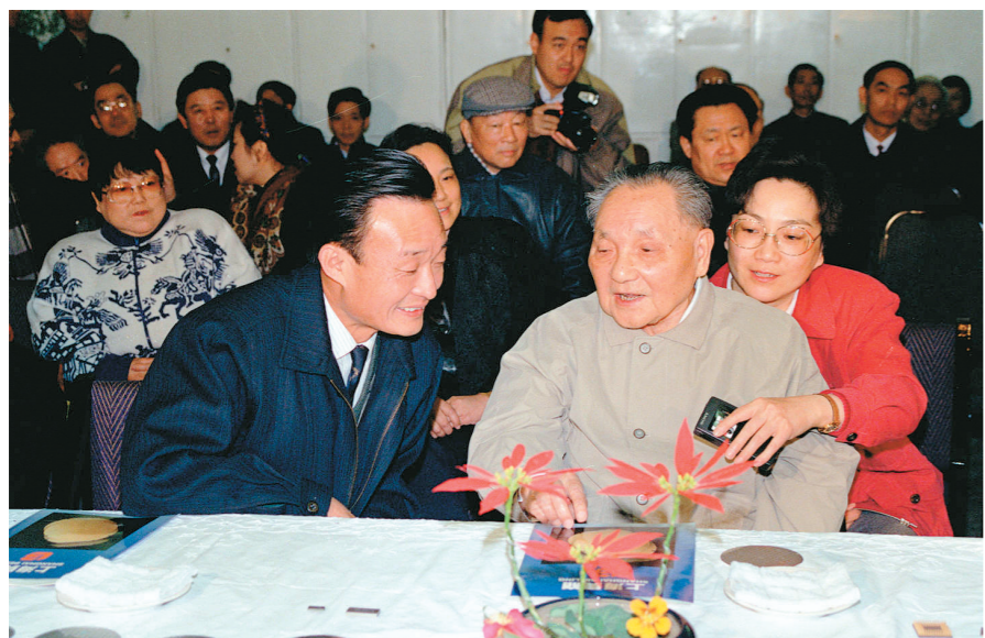
1992年2月10日,邓小平同志在上海贝岭微电子制造有限公司参观时与吴邦国同志交谈。