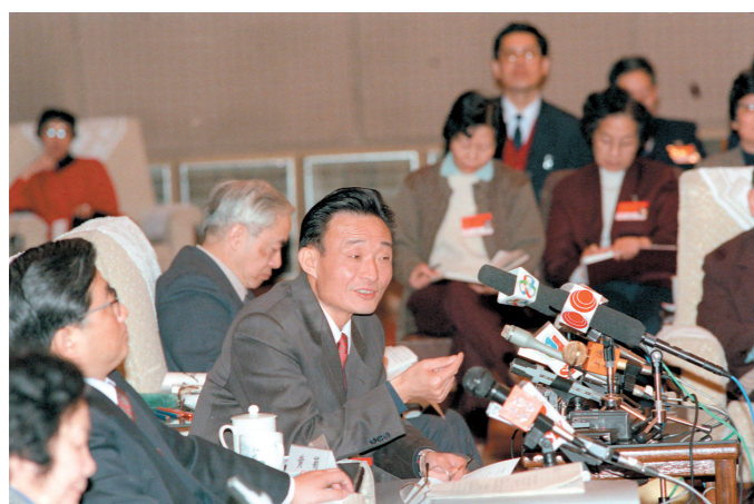
1994年3月,时任上海市委书记的吴邦国同志在全国两会上海代表团全团会议上。