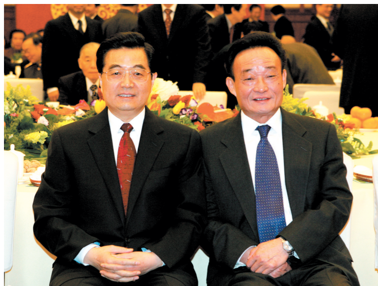
2005年1月1日,全国政协在北京举行新年茶话会。这是胡锦涛同志与吴邦国同志在一起。