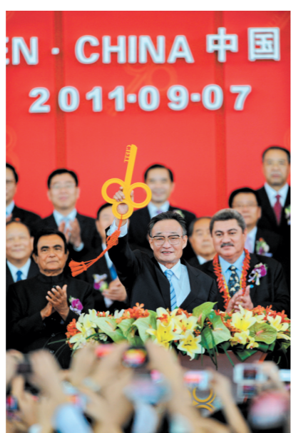
2011年9月7日,吴邦国同志在福建厦门出席第十五届中国国际投资贸易洽谈会开幕式。