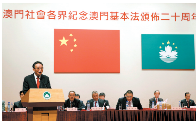
2013年2月21日,吴邦国同志在澳门文化中心出席澳门社会各界纪念澳门基本法颁布20周年启动大会并发表讲话。