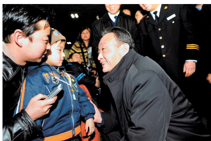
2008年2月3日,吴邦国同志在北京西站候车室与旅客交谈。