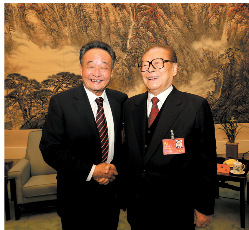
2012年11月14日,中国共产党第十八次全国代表大会在北京闭幕。这是闭幕会前,江泽民同志与吴邦国同志在一起。