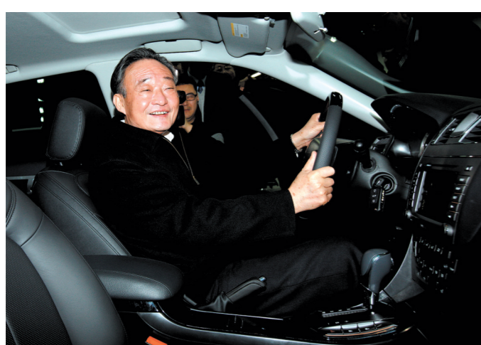
2010年1月30日,吴邦国同志在上海汽车集团股份有限公司技术中心察看新能源汽车。