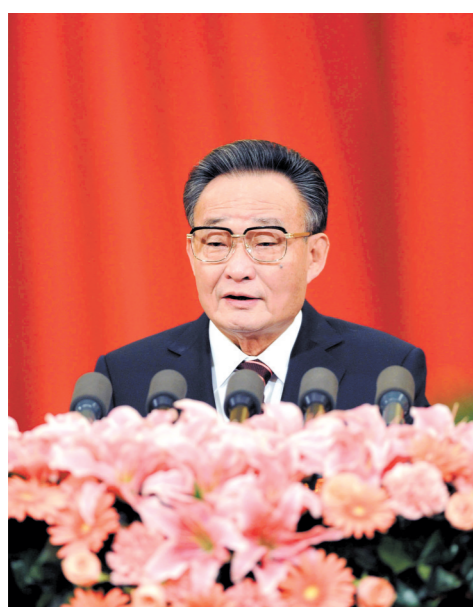
2011年3月10日,十一届全国人大四次会议在北京人民大会堂举行第二次全体会议。吴邦国同志作全国人民代表大会常务委员会工作报告。