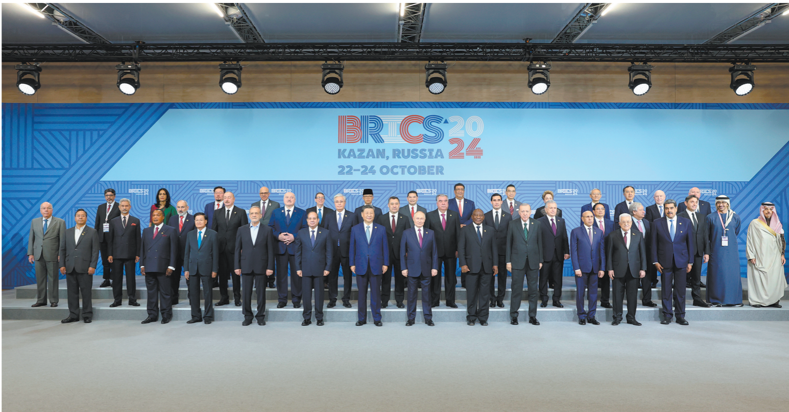
当地时间10月24日上午,国家主席习近平在喀山会展中心出席“金砖+”领导人对话会并发表题为《汇聚“全球南方”磅礴力量 共同推动构建人类命运共同体》的重要讲话。