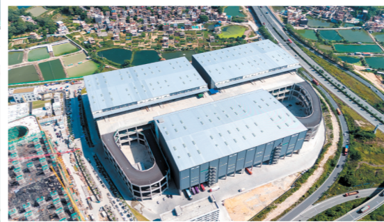
↑ 颀颀(华南)预制菜产业基地全景图。