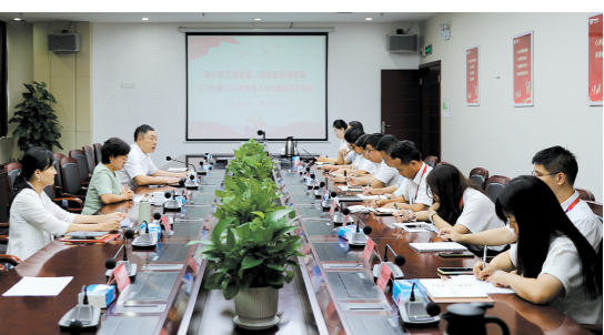
江门联通积极贯彻落实党的二十届三中全会精神。