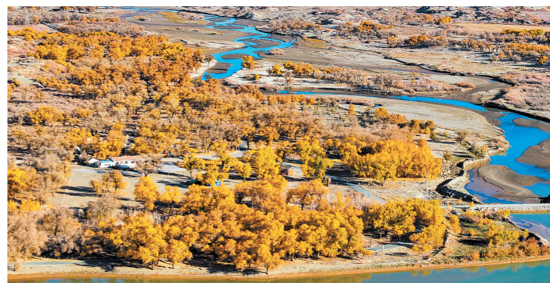
这是10月27日在额济纳旗黑河沿岸拍摄的野胡杨(无人机照片)。金秋时节,内蒙古额济纳旗的胡杨林美景如画。