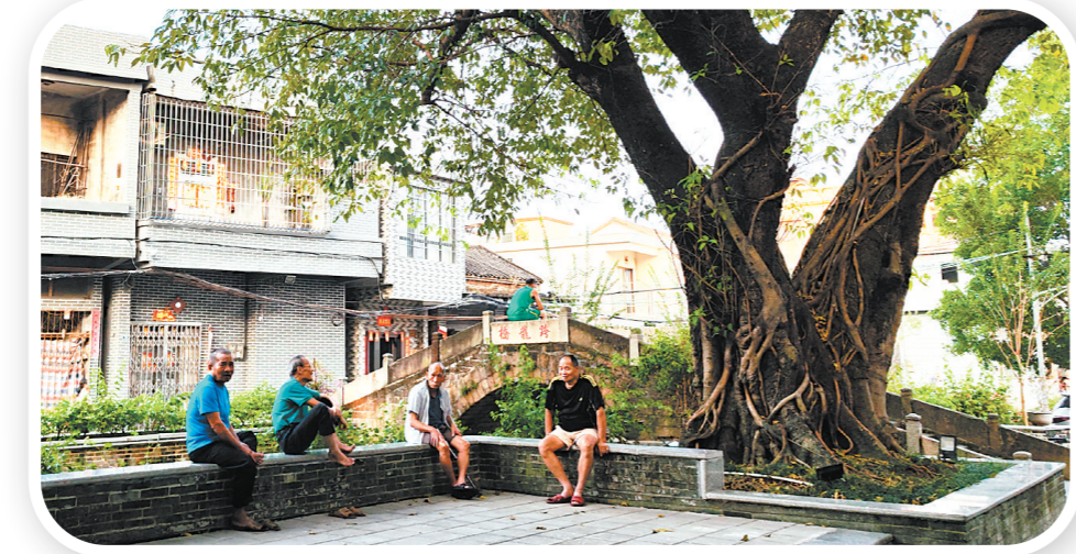
老人们在古榕树下乘凉话家常。

提升,打造了一条辐射带动能力强、能够代表江海乡村振兴发展水平的精品新乡村示范带。