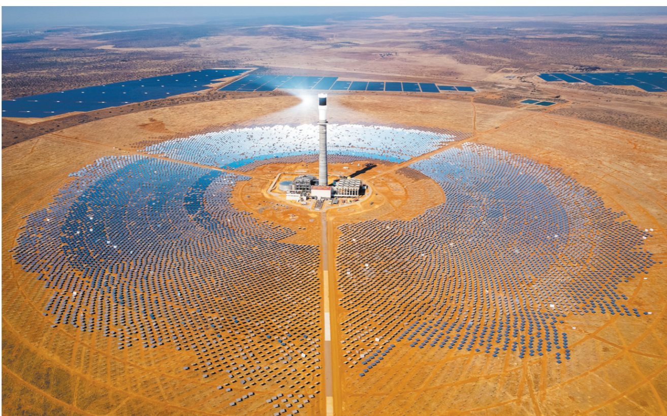
这是2024年8月20日在南非北开普省拍摄的南非红石100兆瓦塔式熔盐光热电站项目(无人机照片)。由中国电建集团山东电建三公司承建的南非红石100兆瓦塔式熔盐光热电站项目是撒哈拉以南非洲首个塔式熔盐光热电站项目，也是南非最大可再生能源投资项目之一。

以世界各国一律平等、共同进步超越霸权主义。中国式现代化突破西方现代文明长期推行的强权政治和对外扩张，强调不同文明和平共处、合作共赢。今年举行的第七届中国国际进口博览会，为37个最不发达国家提供120多个免费展位，扩容非洲产品专区，并举办全球南方可持续发展与中非合作